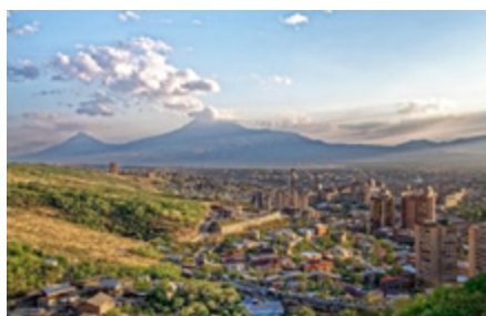
Die Stadt Jerewan, Hauptstadt Armeniens, im armenischen Hochland mit Blick auf den ruhenden Vulkan Ararat.

lerdings nicht und gemeinsam wurde im Anschluss u.a. zu den Themen Wasser- und Stromverbrauch überlegt, wie man den Fußabdruck im Alltag verkleinern könnte. Denn neben dem Konsum von Lebensmitteln wie Tiefkühl- oder Fleischprodukten erzielten die meisten Jugendlichen die höchste Punktzahl beim Fußspurenspiel u.a. durch die Nutzung elektrischer Geräte, häufiges Duschen oder durch die Fahrt mit dem Auto. Gemeinsam einen bewussteren Konsum anzustreben, mal Handypausen zu machen und als Menschen zusammenzuhalten, könne das Leben für alle Menschen schützen, lautete das Ergebnis der gemeinsamen Austauschrunden.