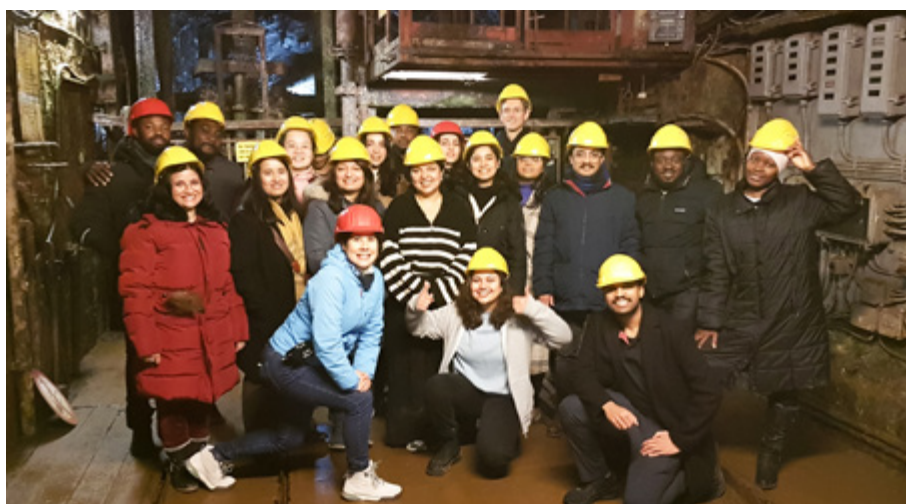
Unter Tage erhält die Seminargruppe einen Einblick in die Bergbautechnologie und die Arbeitsbedingungen der Bergarbeiter in verschiedenen Epochen.