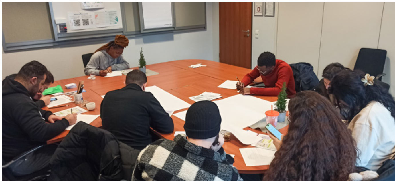
Studierende überlegen sich in Einzelarbeit eigene Handabdruck-Ideen.