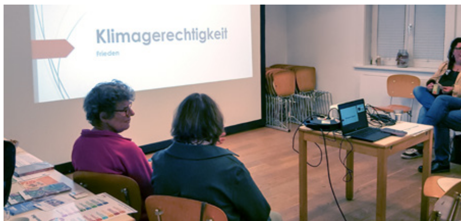
Am 24. September 2024 versammelten sich Interessierte im Gemeindehaus der Neuenhäuser Kirchengemeinde zum Thema Klimagerechtigkeit.