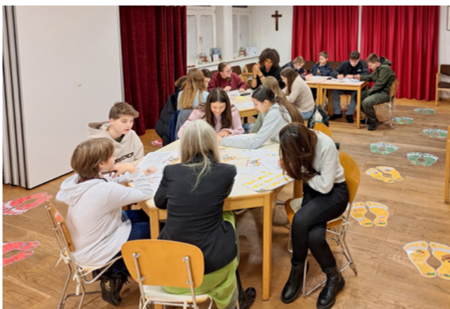
Konfirmanden-Nachmittag am 14. November 2024 in der Kreuzkirche in Celle: Zum Einstieg ins Thema beleuchten die Jugendlichen ihren eigenen Lebensstil mit der Frage: „Was mache oder esse ich richtig gerne?“