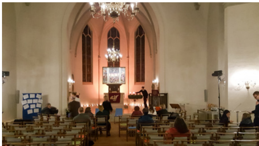
Vesperabend zum 2. Advent in der Kreuzkirche Hannover unter dem Motto „Konnektivität – Was ist gutes Leben?“