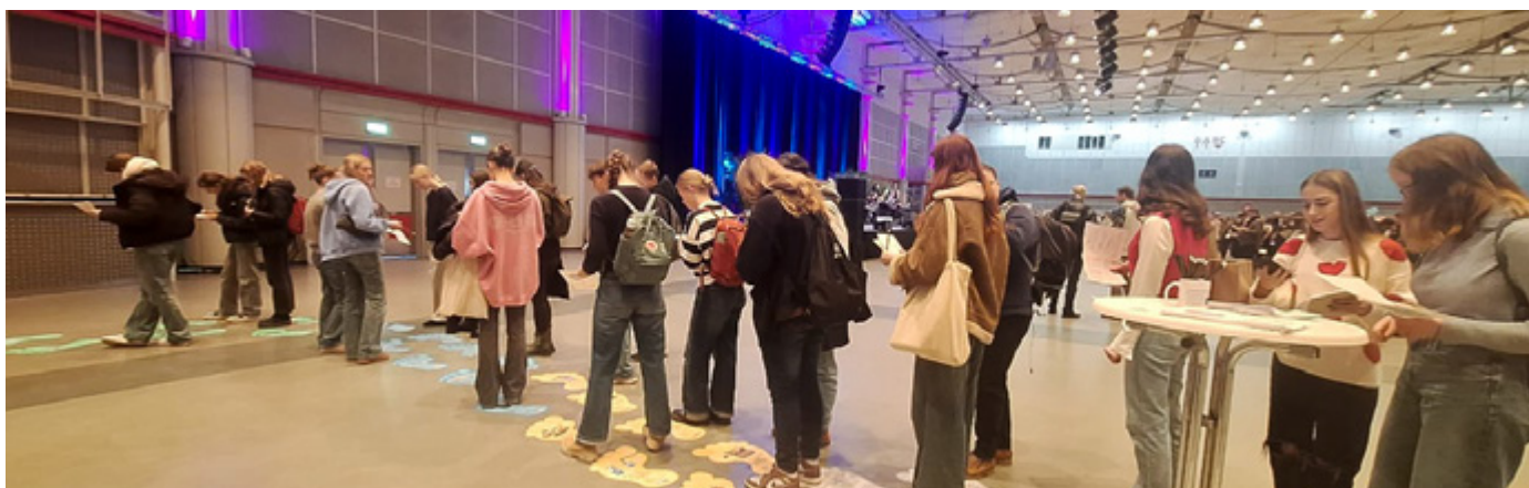
Schülerinnen und Schüler beim Beantworten der Fragen des Fußabdruck-Parcours