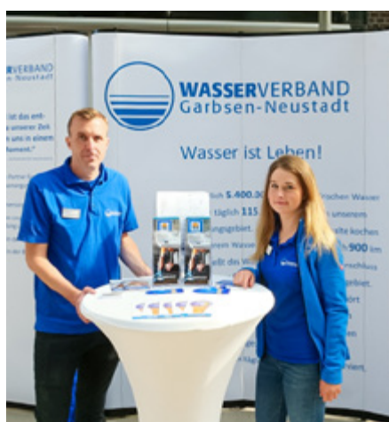
Mitarbeitende des Wasserverbandes Garbsen-Neustadt informieren über die Auswirkungen des Klimawandels auf die regionale Wasserversorgung.