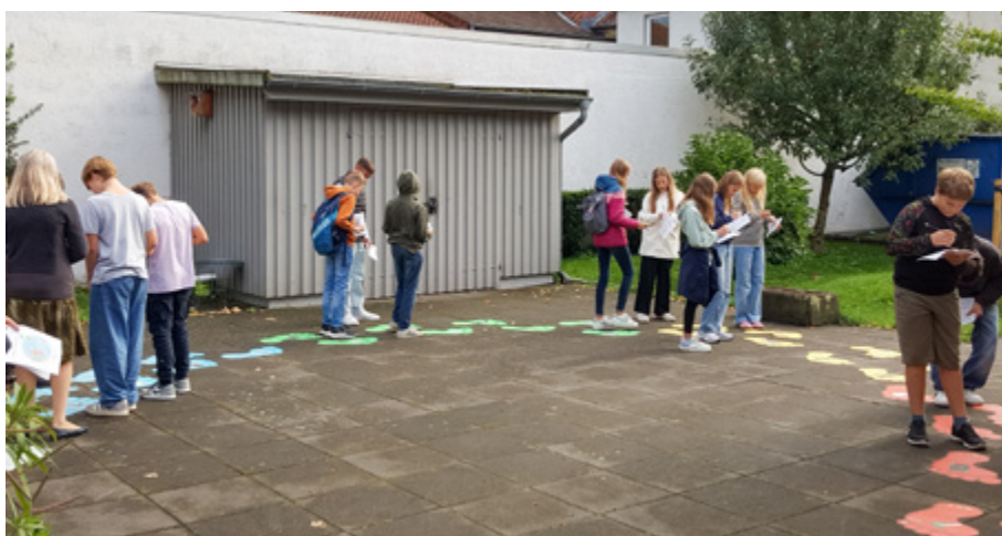
Konfirmanden-Nachmittag am 24. September 2024 in der Neuenhäuser Kirche in Celle: Vor dem Gemeindehaus testeten die Jugendlichen ihren ökologischen Fußabdruck.