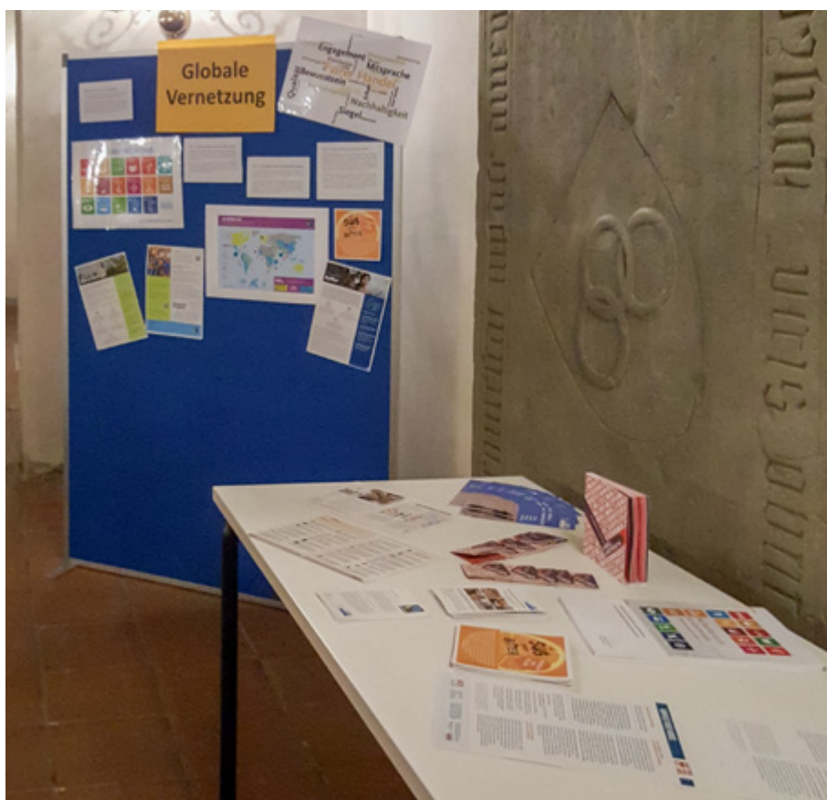
Die Themenstation „Globale Vernetzung“ veranschaulicht, wie die Umsetzung der Nachhaltigkeitsziele der Agenda 2030 und der Faire Handel ein „gutes Leben“ für Menschen hier und weltweit ermöglichen können.