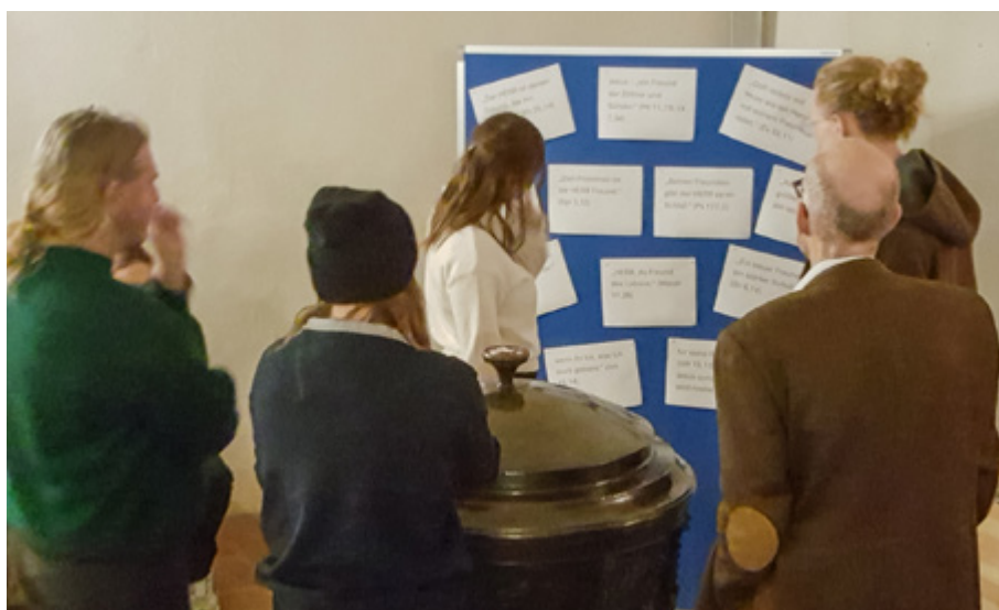
Ausgewählte Bibelzitate mit Bezug auf Freundschaft laden zum Austausch ein.

Mit etwas Bewegung zwischendurch wurden die Besucher eingeladen, sich an zwei Themen-Stationen miteinander auszutauschen: