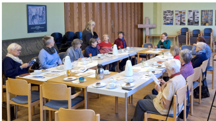
Am 27. November 2024 in der Kreuzkirche in Celle: Fairer Handel und Klimaschutz am Beispiel von Kaffee.