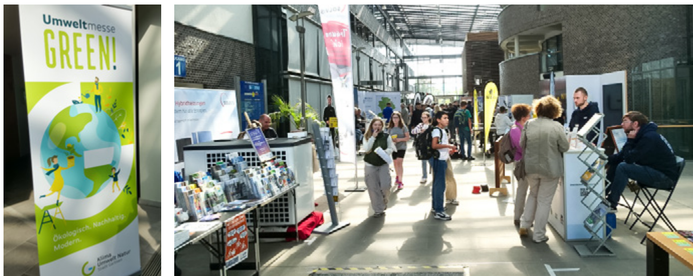
Info-Stände zur Umweltmesse „GREEN UP!“ 2024 im Garbsener Rathaus, u.a. ADFC vorne links, Klimaschutzagentur Region Hannover vorne rechts