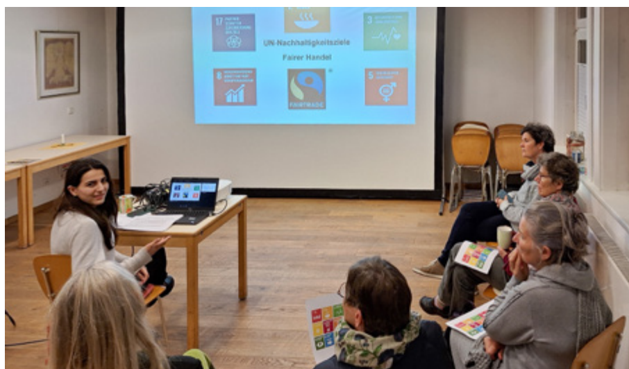
Am 14. November 2024 fand im Gemeindehaus der Neuenhäuser Kirchengemeinde eine Veranstaltung zu nachhaltiger Entwicklung und den Umsetzungen im Fairen Handel statt.

yan, wie u.a. der Klimawandel das Risiko nationaler oder internationaler Konflikte und somit auch den Frieden in einem Land gefährden kann. In der anschließenden offenen Diskussionsrunde wurde sich u.a. über die Herausforderungen auf dem Weg zur Klimagerechtigkeit ausgetauscht. Wie gehen z.B. heute vom Krieg heimgesuchte Länder mit dem Klimawandel um und wie können z.B. existentielle Bedrohungen durch Krieg, knappe finanzielle Ressourcen, schlecht entwickelte lokale Strukturen und mangelndes Bewusstsein ein Engagement für den Klimaschutz beeinflussen? Ein Austausch-Format, das Platz für Fragen, Wünsche und Informationen zum Mitmachen hatte.