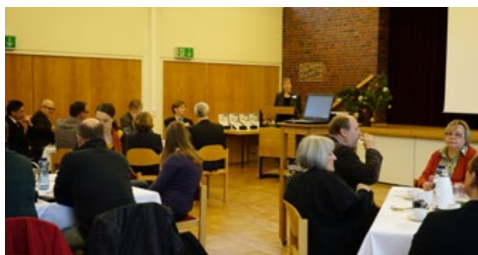
Die Veranstaltung zur Preisübergabe in Sande 2014