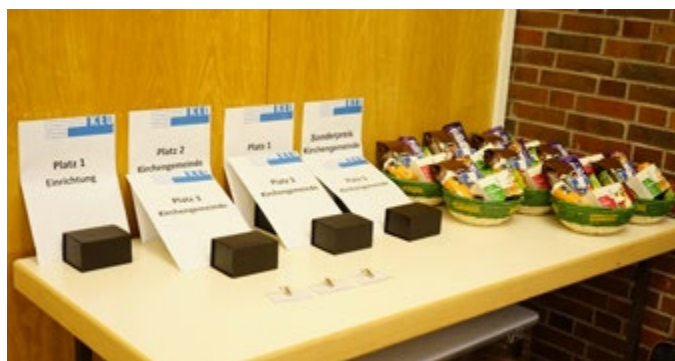
Die Preise warten noch auf Ihre Empfänger ...