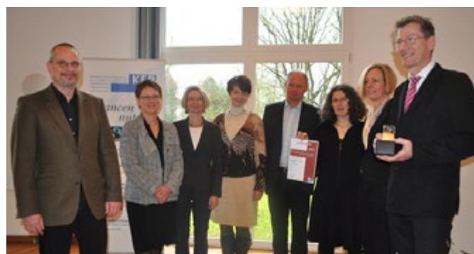
Die Gewinner des 1. Preises 2012: Das Ev.-luth. Bildungszentrum Bad Bederkesa