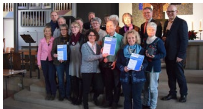
Alle Preisträger in 2016