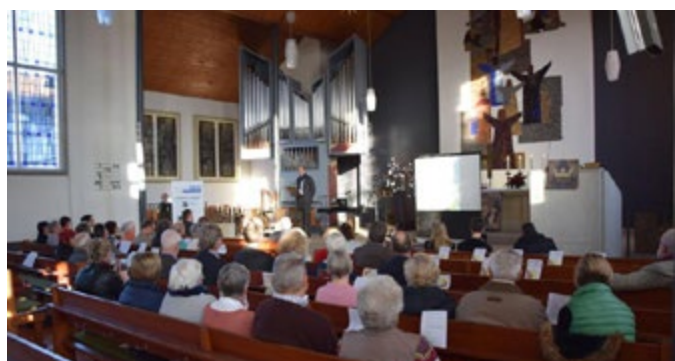
Die Veranstaltung zur Preisübergabe in Wunstorf Bokeloh 2016