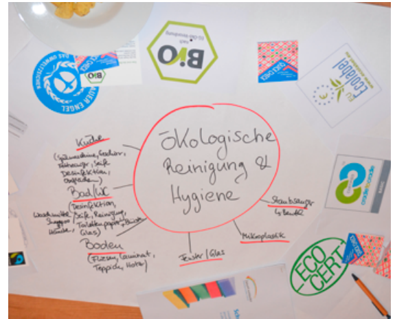
Foto 1 und 2: Workshop-Tische zu den Bereichen öko-faire Lebensmittel unter Anleitung von KED-Praktikantin Ines Alves und umweltfreundliche Reinigungsmittel mit KED-Referentin Rebecca Neumann.