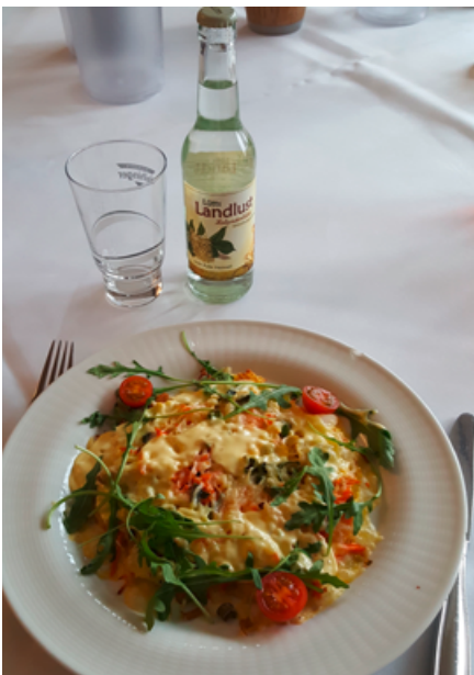
Lokale Spezialität „Wittlager Kartoffelplate“ mit Limonade aus der Region. (Rebecca Neumann)

auch um ökologische Reinigungs- und Hygieneartikel mit möglichst geringen Auswirkungen auf die Umwelt.