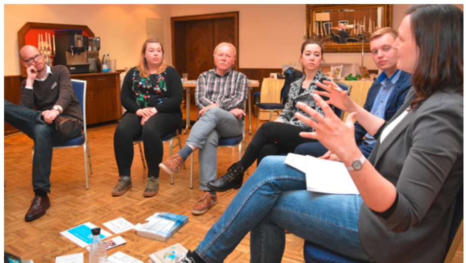
Foto 4: Zusammenfassung der Ergebnisse aus den drei Workshops mit Tipps für eine nachhaltige Umsetzung in den Einrichtungen.

Ein vorangegangenes Treffen am 18. Februar 2019 diente u.a. dazu, anhand einer Bedürfnisanalyse die Bereiche der fairen und ökologischen Beschaffung zu ermitteln, bei denen die Teilnehmer noch Wissen und Handlungskompetenzen benötigen. Beim Folgetreffen wurden drei dieser Themenblöcke im Workshop-Format bearbeitet. Neben der Beschaffung von fairen und ökologischen Lebensmitteln drehte sich der erste Teil des Abends