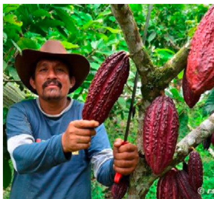
Kleinbäuerliche Kakaoplantage