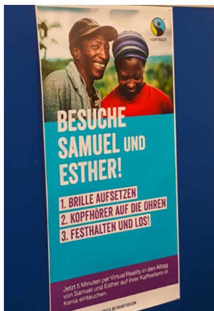
Aktion virtueller Besuch einer Kaffeeplantage in Kenia. Das Video ist zu finden unter: (Rebecca Neumann)

Am 6. Juni 2019 hat die jährliche Mitgliederversammlung von TransFair e.V. in Köln stattgefunden. Als Vereinsmit-