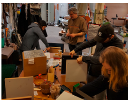
Upcycling-Werkstatt II: Aus Holzresten werden Bücherregale gebaut

Nach einer kurzen Pause mit leckeren Brötchen und öko-fairen Aufstrichen ging es gestärkt zum Hauptteil des Tages über, den Workshops in der Upcycling-Werkstatt. Hier hatten die Studierenden verschiedene Möglichkeiten, aktiv zu werden. Neben der Weiterverarbeitung