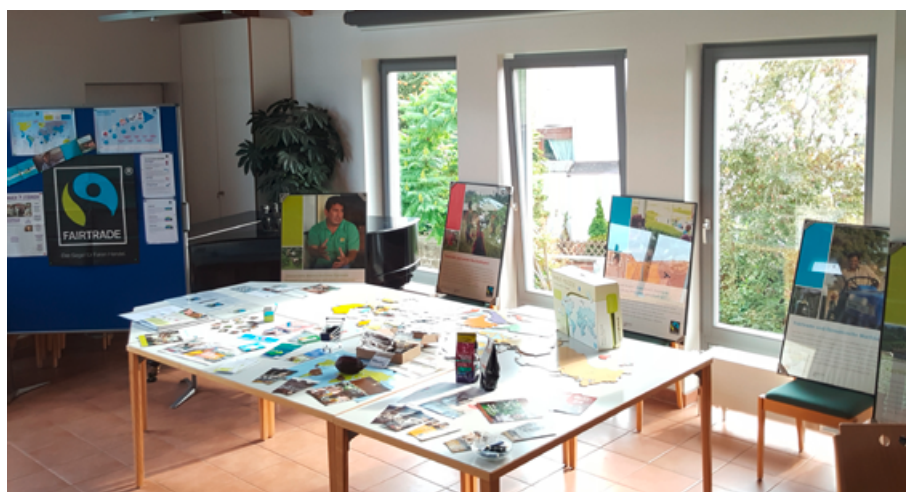
„Aktionsecke“ mit Bildungsmaterialien zum Fairen Handel, wie der Kakao-Box (Tischmitte vorne) oder der Ausstellung „Säulen der Nachhaltigkeit“ (Wand hinten), die über den KED ausgeliehen werden können. Teilnehmende fanden hier auch Informationen und Materialien zu möglichen Aktionen zum Fairen Handel für ihre Einrichtungen.

die es neben Baumwolle auch für Kakao und Zucker gibt, ermöglichen eine produktunabhängige Verwendung von fair gehandelten Rohstoffen. Eine weitere Frage folgte zum Bezug von Produkten mit bestimmten Siegeln aus dem Fairen Handel.