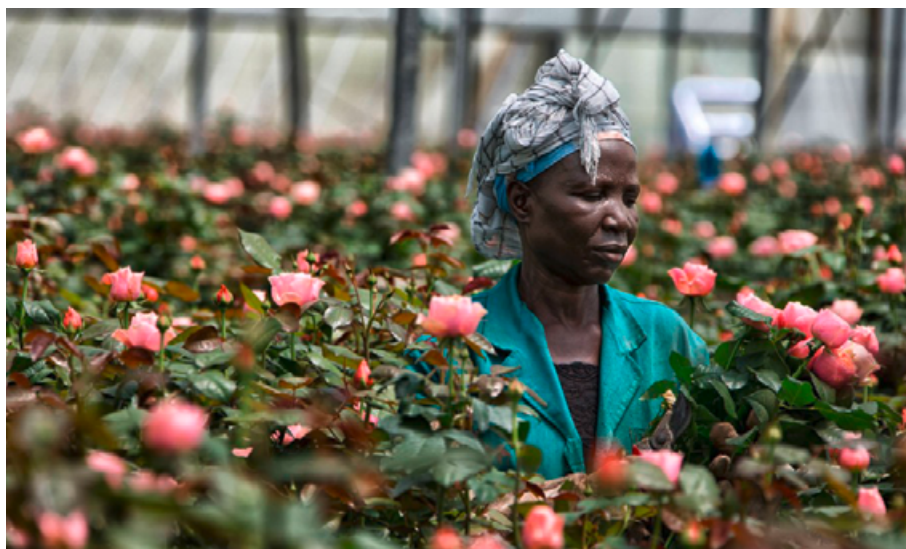
Blumenplantage in Kenia

Das erste Fallbeispiel eines Blumenunternehmens in Kenia bildet ein Positivbeispiel bezüglich der Mitbestimmung von Lohnarbeitskräften bei der Steuerung der FT-Prämie. Vor Ort besetzen Lohnarbeitskräfte einflussreiche Positionen innerhalb der Organisation. Es werden Investitionen in Weiterbildungsmaßnahmen der Lohnarbeiter getätigt, was eine Übung zur Vorbereitung und Durchführung von Versammlungen darstellt. Daraus resultiert vor allem der Vorteil für die Produzent*innen, dass Erfahrungen gesammelt werden können, weitreichende Entscheidungen zu treffen und sich persönlich weiter zu entwickeln. Dies bildet optimale Chancen, innerhalb des Unternehmens aufzusteigen und Arbeitskräfte hervorzubringen, welche das Unternehmen zukunftsorientiert mitgestalten.